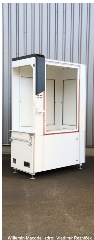
Willemin Macodel