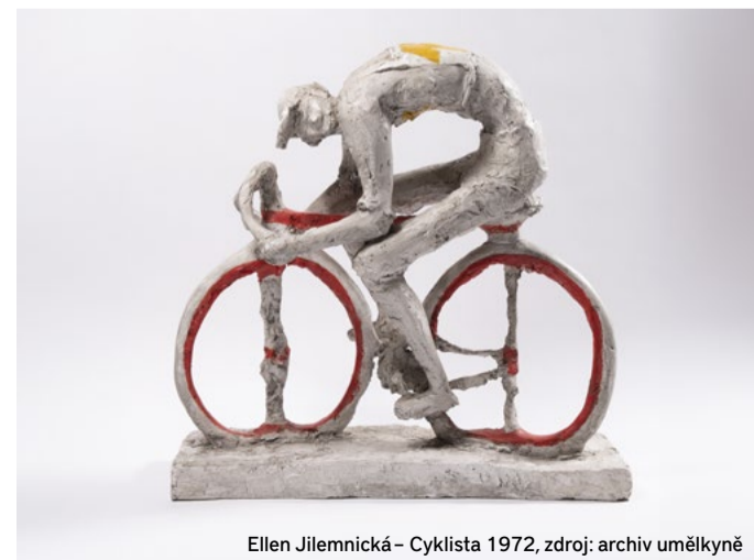
Ellen Jilemnická – Cyklista 1972, zdroj: archiv umělkyně