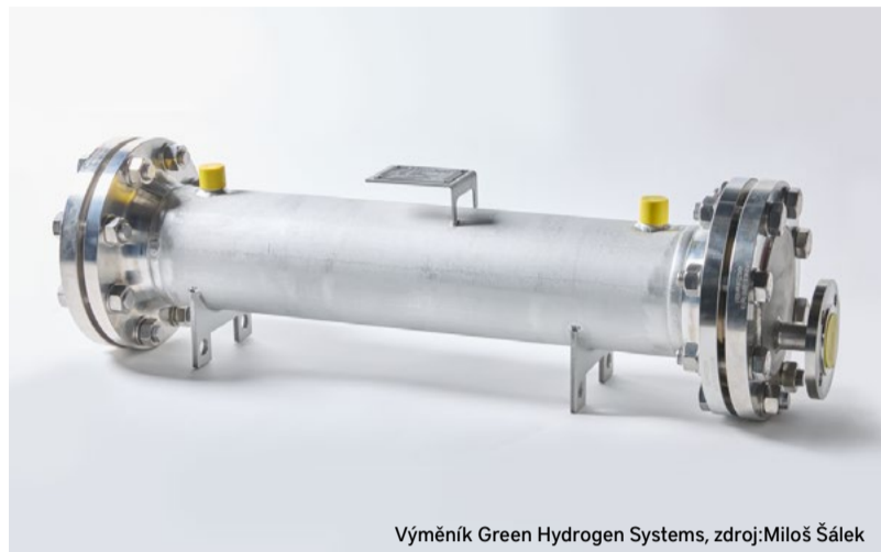
Výměník Green Hydrogen Systems